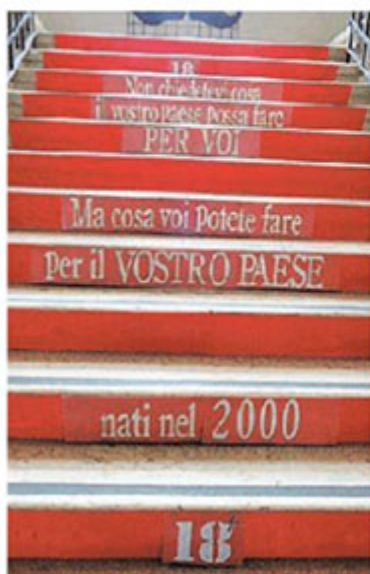
La scala con la frase di Kennedy

Nuova formula per 18Plus, sabato la consegna della Costituzione