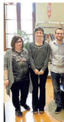
Gli amministratori dei Co

Sarà l'inizio di un lavoro di co-progettazione che permetterà di aprire tavoli di confronto con i vari amministratori a cui proporre nuove idee. Molte di queste domande sono state formulate dagli studenti dell'istituto Manzoni il 26 marzo durante un'assemblea molto partecipata. Quest'anno oltre a tutti i Comuni del distretto di Suzzara, le scuole, tra cui l'istituto Manzoni, il Centro di formazione professionale Arti e Mestieri di Suzzara e l'istituto agrario Strozzi di Palidano, sono entrati nel 18Plus le amministrazioni co-