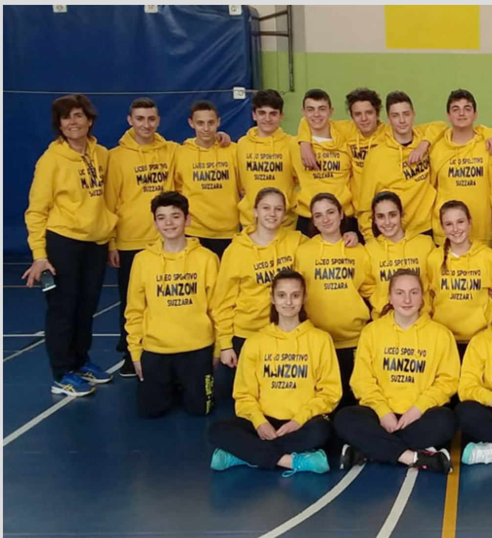
la nuova divisa del nostro Liceo Sportivo