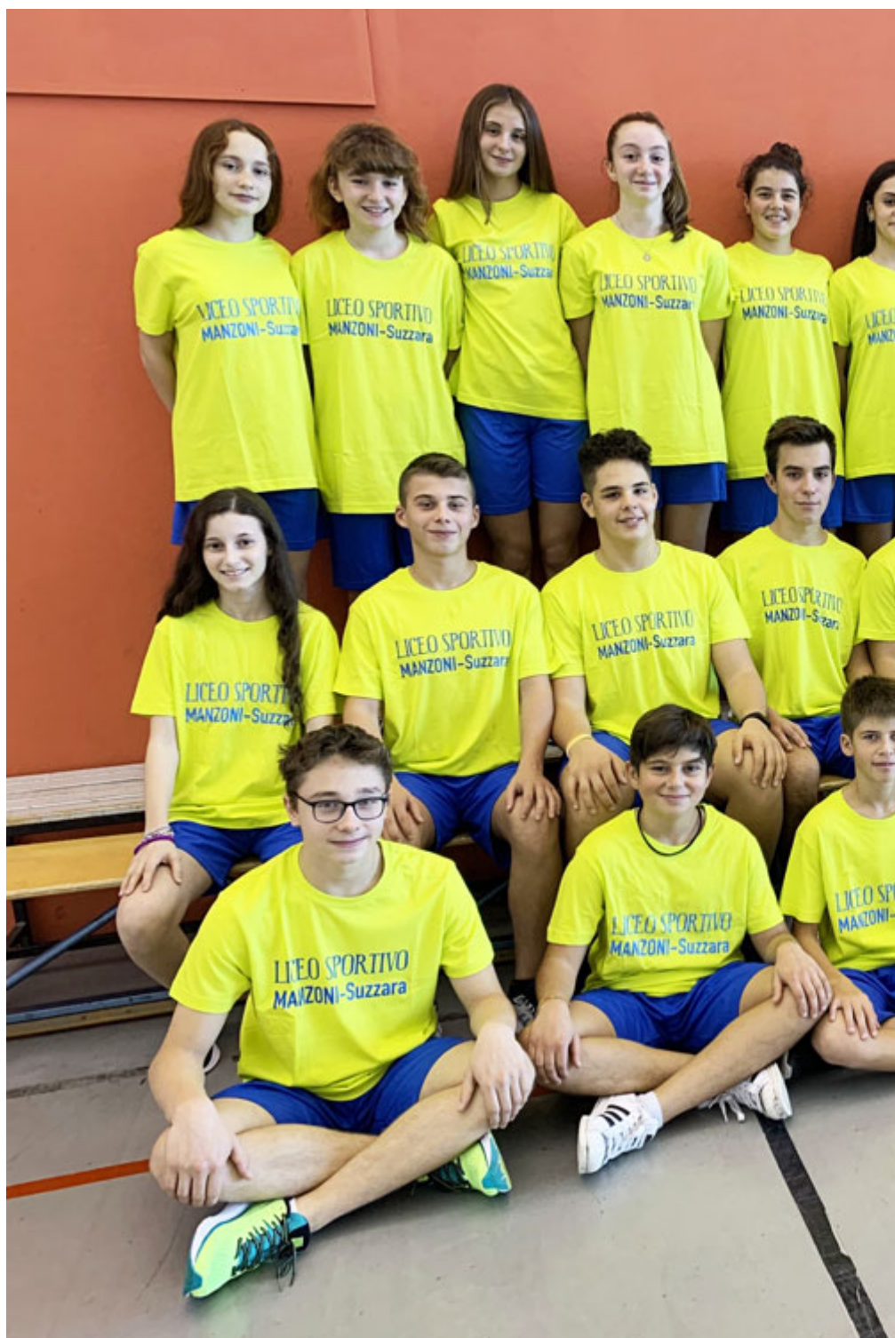
Le nuove divise del Liceo sportivo!