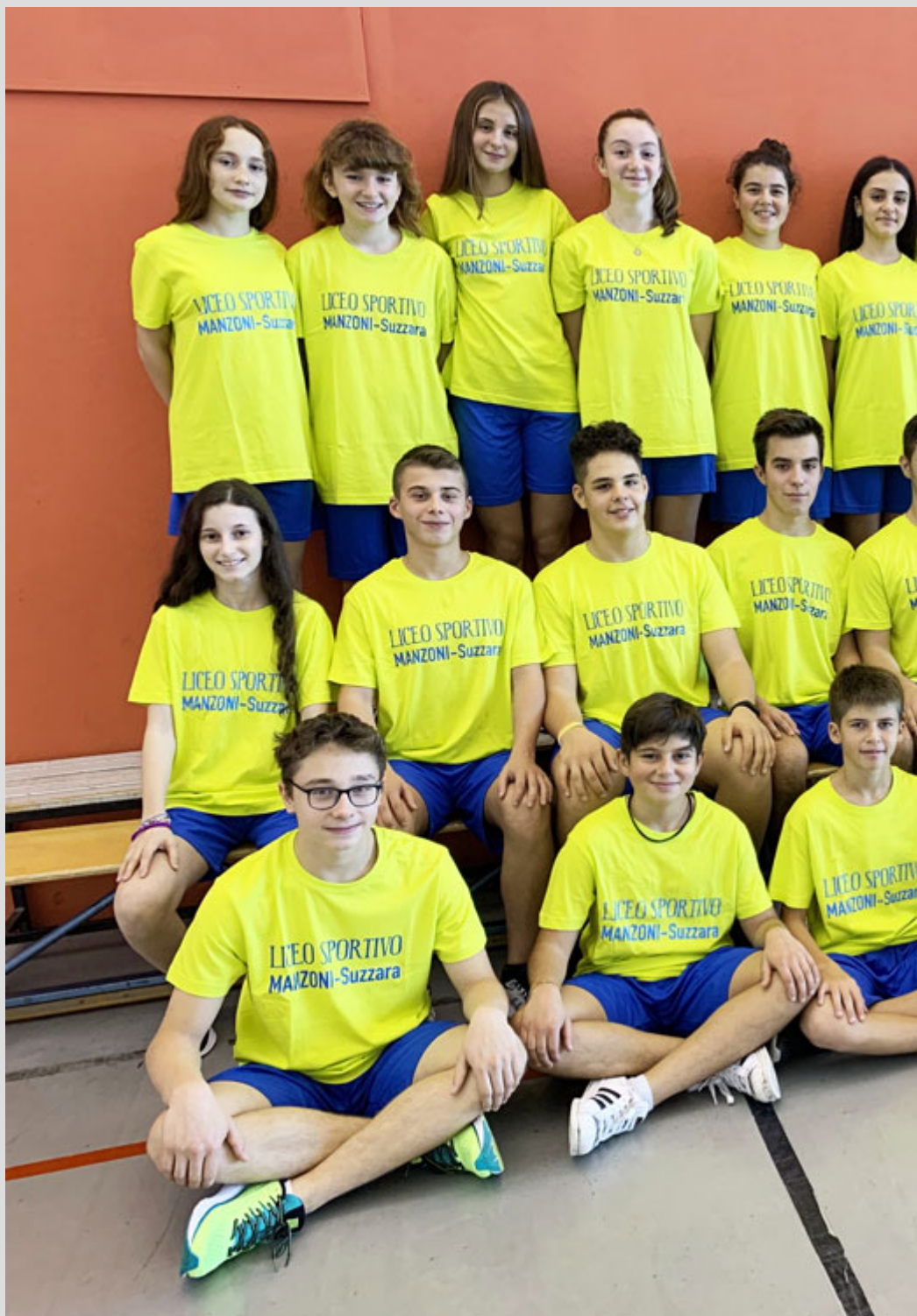
Le nuove divise del Liceo sportivo!