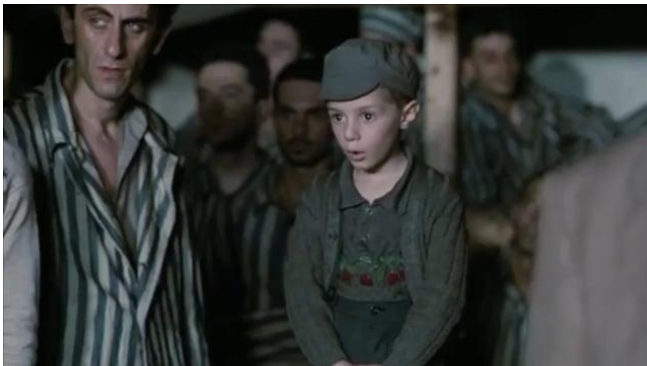
Videomontaggio a cura dei Rappresentanti d'Istituto Manzoni